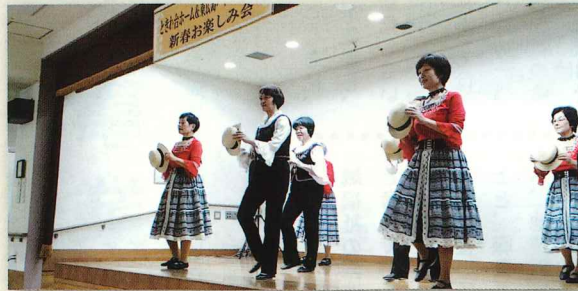
←きれいな衣装で踊るのは八本松 フォークダンス教室の生徒さん。 90歳代の方も踊られていると聞 き驚きました!