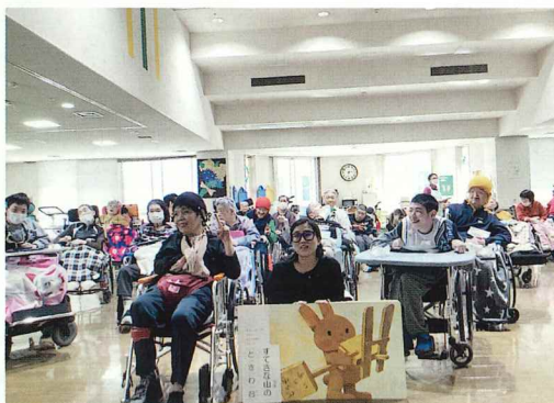
素晴らしい演奏をありがとうございました。