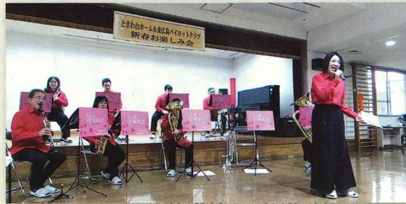
←一昨年・昨年も演奏された広島 吹奏楽団様。団員さんの軽快な 司会運びも相まって、目にも耳 にも楽しい演奏会でした。