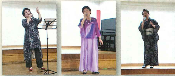
↑パイロットクラブ会員さんによる歌の披露