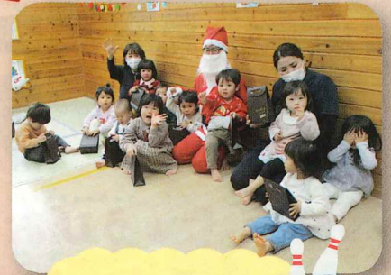
クリスマスボーリング