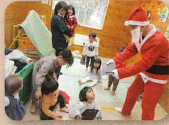
プレゼントもらったよ