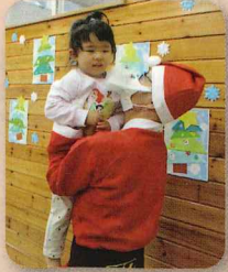
抱っこしてもらったよ♡