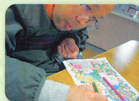
細部まで丁寧に 塗られていますね