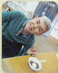
今年もぜんざい待っていました