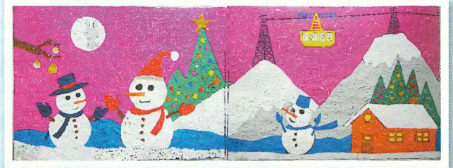
ちぎり絵 模造紙2枚の大作です