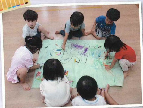
大きな紙に みんなで 描いたよ!