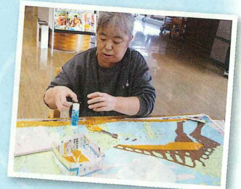
恐竜のちぎり絵を作成中