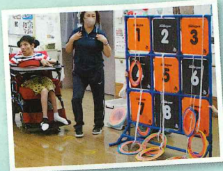
初めてみるディスクゲッター 大きいなあ

「スポーツ交流センター おりづる」より講師の方をお迎えし、久しぶりにスポーツレクリエーションを行いました。