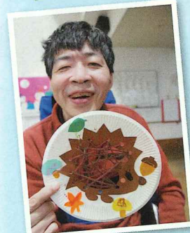
ハリネズミを作りました