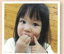
育てたお芋おいしいよ♪