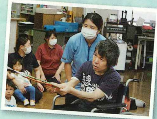
しっかり引っ張って狙うよ。