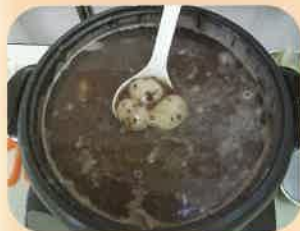
グツグツ煮えて美味しそう♥

利用者の皆さんで、ぜんざい週間を満喫しました。甘い物を食べて、心も身体も大満足でした。