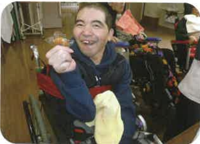
お菓子はどれにしようかな～

午前はおもちつき、午後からは三味線&しの笛の演奏がありました。その後は、午前についたおもちが入ったぜんざいやお菓子を食べて一年の幕あけを祝いました！