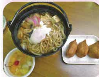
色どりあざやかに作れました。