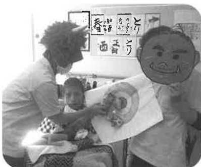
協力して福を内に。