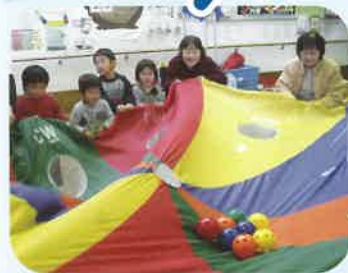
穴の中にボールが入るかな~?