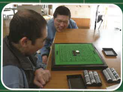
ゆっくり、まったりと。