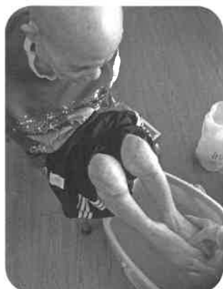
お湯かげん いかがでしょう?