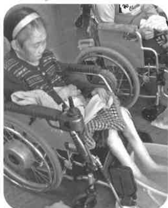
いい香りがします。