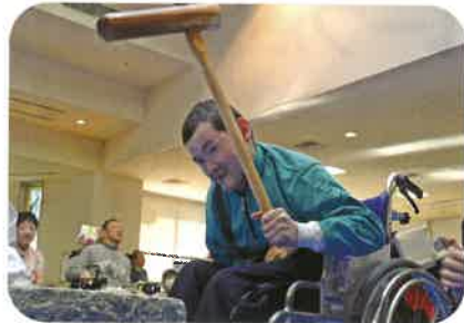
美味しいおもちをつくぞ～！

午前はおもちつき、午後からは三味線&しの笛の演奏がありました。その後は、午前についたおもちが入ったぜんざいやお菓子を食べて一年の幕あけを祝いました！