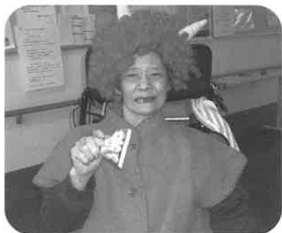
健康管理はマメに♪