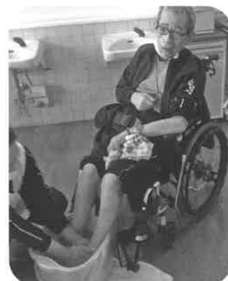
マッサージも一緒に♪