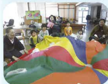
これぞ多世代総力の結集!!