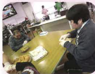
上手に握れました!