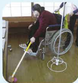
クラブの使い方、なかなか難しいです

月に1度行われるスポーツレクリエーション! デイサービス利用者の方と多世代の児童達と力を合わせて楽しい時間を過ごし、大盛りあがりな1日となりました。