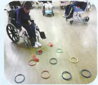
輪の中に、お手玉を入れています!