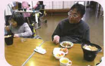
みんなで作った昼食は格別です。

1月のお楽しみ昼食はいなりずしとうどんすきを作りました。利用者の方に、いなりずし作りを手伝っていただき、アツアツなうどんを食べて、心温まる昼食となりました。