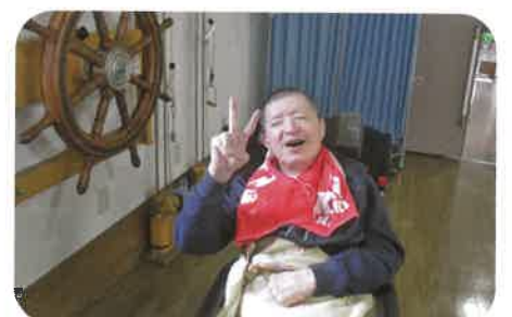
ぜんざい美味しかったよ！