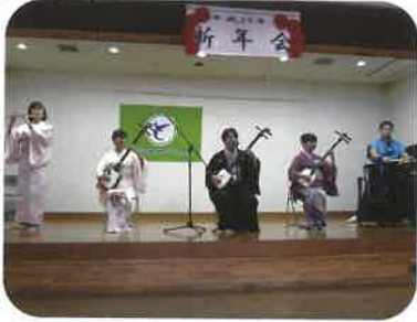
新春にふさわしい音色♪